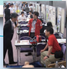
* 上記はイメージ図です